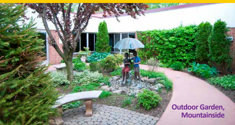
Outdoor Garden, Mountainside

Our commitment to Patient and Family Centered Care sets us apart from other long term care centers by ensuring that your goals for your child are heard and incorporated into their medical and therapeutic care plan. Our team of medical, respiratory, and therapeutic health care professionals develop each child's unique care plan by partnering with your family to best meet the medical and emotional needs of your child.