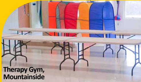
Therapy Gym, Mountainside