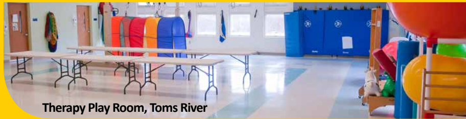
Therapy Play Room, Toms River