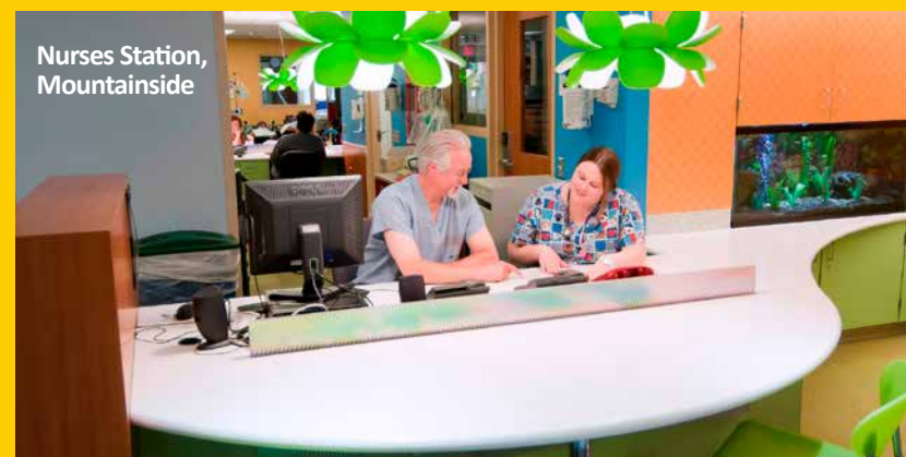
Nurses Station, Mountainside