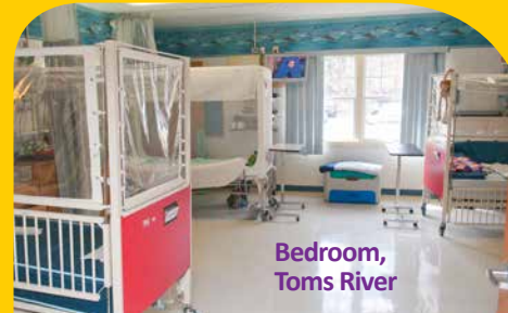
Bedroom, Toms River